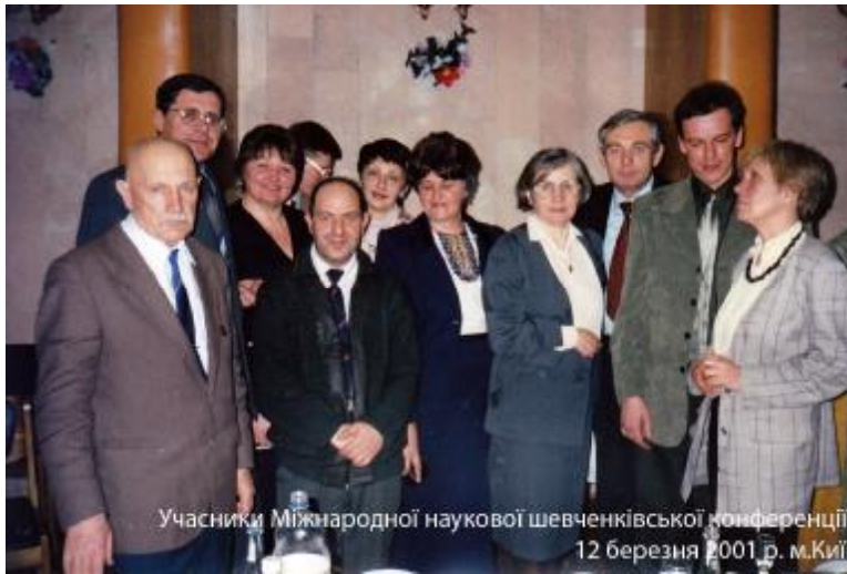
Учасники Міжнародної наукової шевченківської конференції 12 березня 2001 р. м.Київ