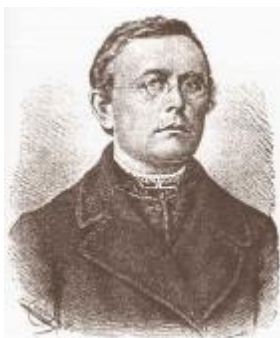
Михайло Вербицький (1815-1870), автор музики Державного гімну України