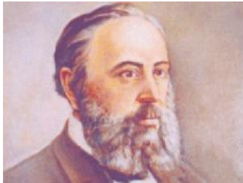
Павло Чубинський (1839-1884), автор тексту Державного Гімну України