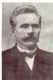
Д. І. Яворницький